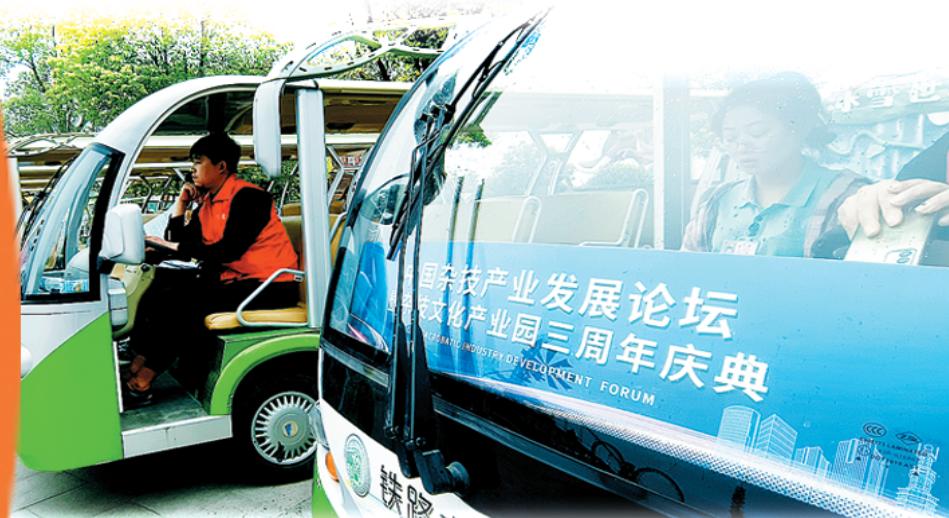
工作人员已做好迎接中国杂技产业发展论坛的准备。