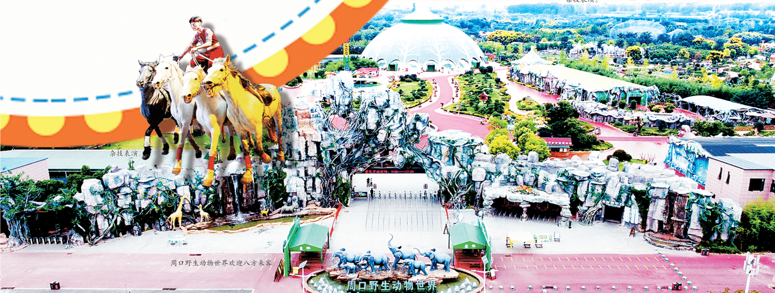
周口野生动物世界欢迎八方来客。