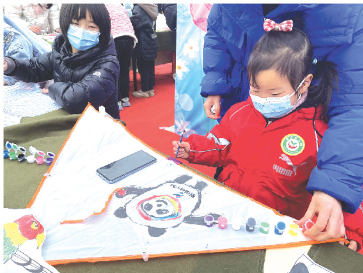
2月15日上午，“放飞春天——儿童DIY手绘风筝”活动在周口市文化艺术中心西广场如期举办。一名身穿红色棉服的小女孩在妈妈的帮助下，创作完成了一只画有“冰墩墩”形象的手绘风筝。