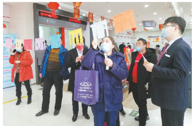
元宵佳节，工行周口分行举办丰富多彩的猜灯谜活动，为员工、客户送祝福，营造了祥和欢乐的节日氛围。