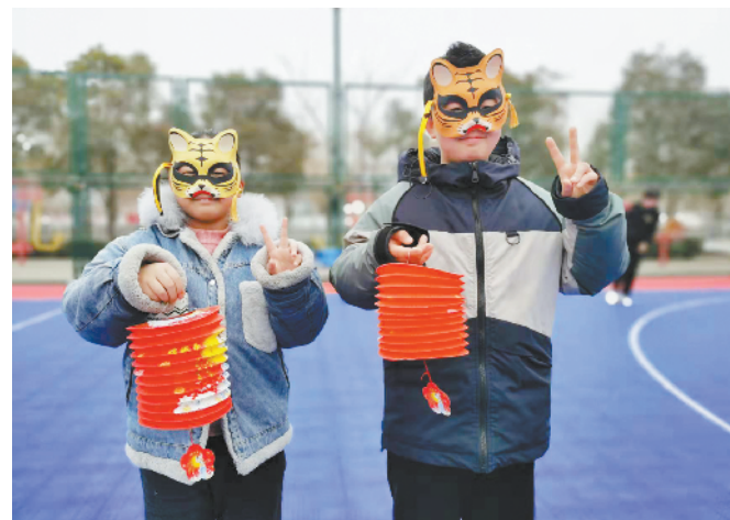
2月15日，川汇区城南街道办事处联盟新城社区广场上热闹非凡，一群戴着老虎面具的“虎娃”参加了由川汇区民政局、川汇区城南街道办事处、周口市青昱社会工作服务中心举办的“童手拉手 欢乐闹元宵”活动。