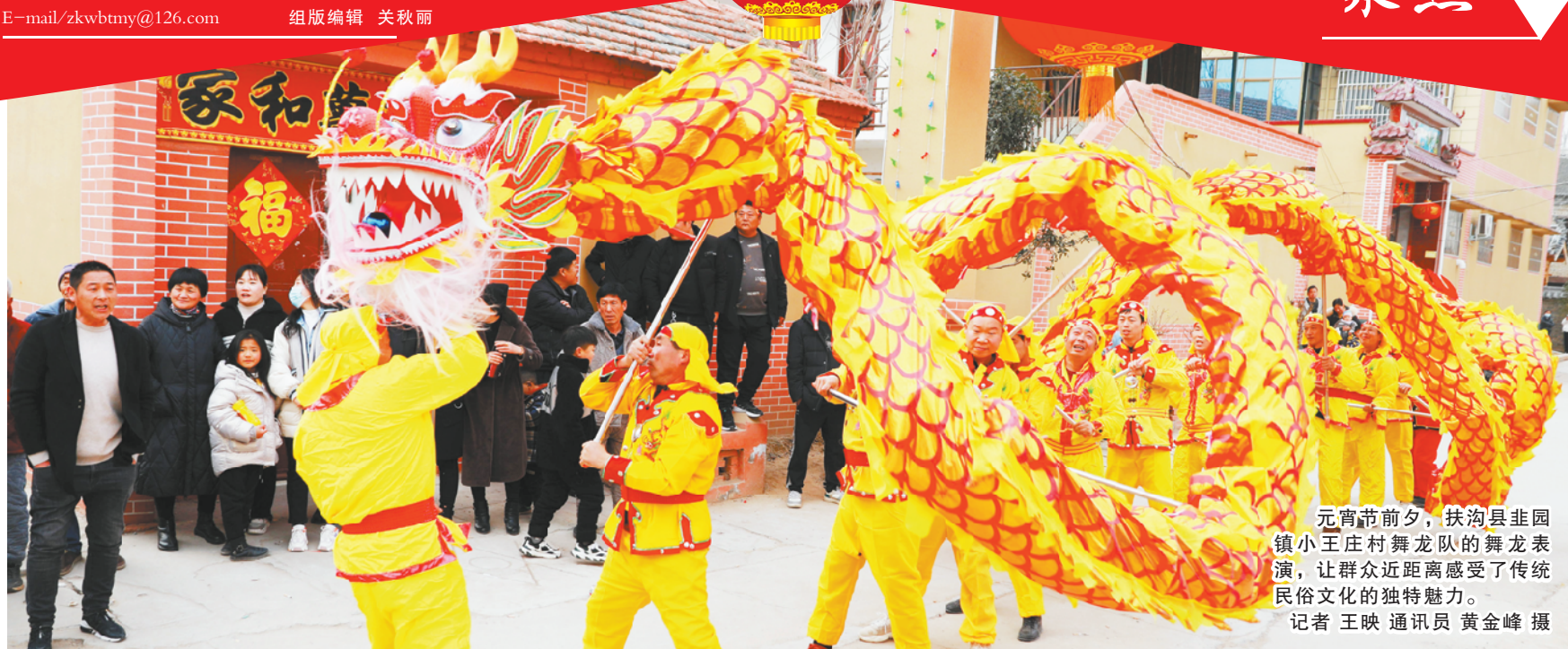
元宵节前夕，扶沟县韭园镇小王庄村舞龙队的舞龙表演，让群众近距离感受了传统民俗文化的独特魅力。